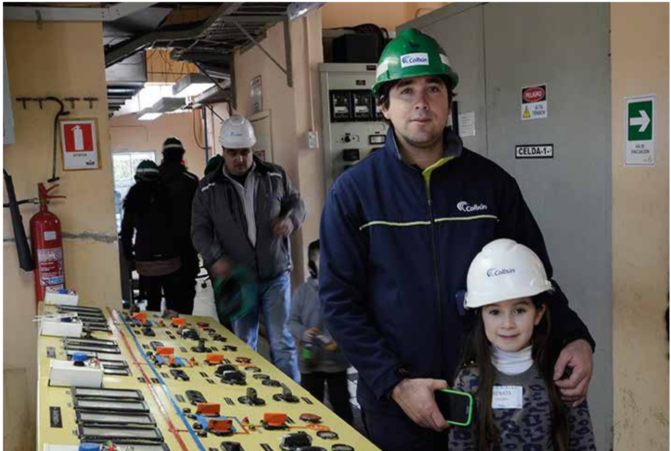
Día con Hijos. Central Carena