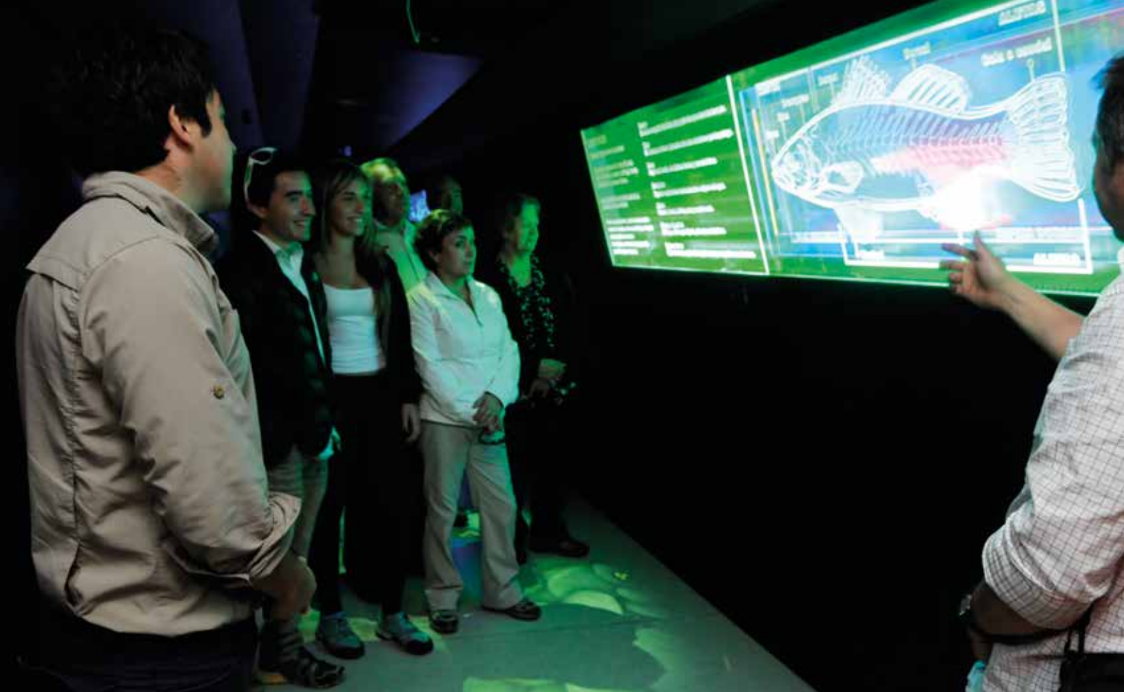
Centro de Visitantes Angostura