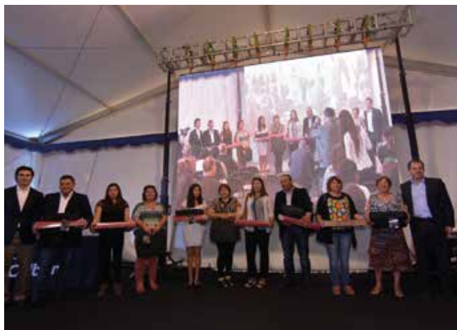
Programa Pesca Futuro en Coronel