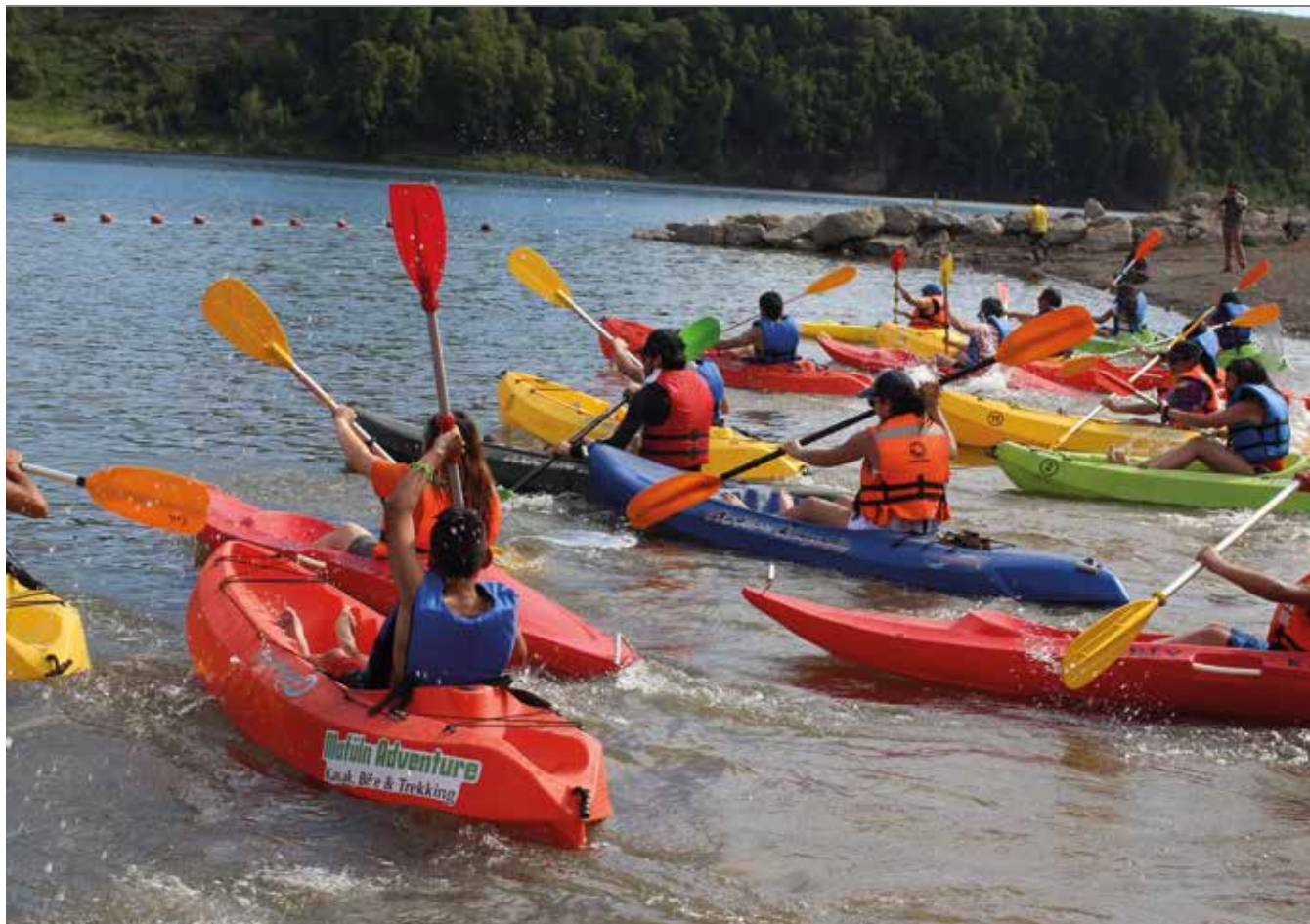
Turismo en Angostura