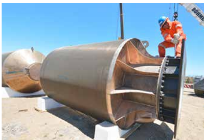
Filtros Santa María