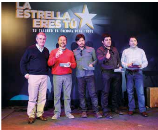
Premiación a los mejores líderes

En esa línea, el compromiso con los trabajadores es entregarles un empleo de calidad en un ambiente de trabajo que les permita la mejora continua, la colaboración y el desarrollo integral. Se busca proveer las herramientas para que lleven a cabo sus funciones motivados, de manera eficiente, efectiva y segura, en consistencia con su vida personal y familiar. Se confía que esto facilitará la atracción y retención de talentos y el desarrollo de trabajadores que logren un alto desempeño.